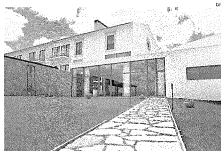
Hotel, situado em Alcobaca, dispõe de serviços personalizados

A celebração do aniversário está agendada para hoje, a partir das 16h00, no Real Abadia